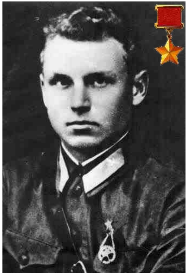
Александр Константинович Горовец

Войсковыми соединениями командовали 217 генералов и адмиралов — белорусов.